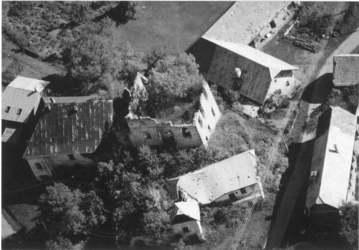
Obr. 2. Letecký pohľad na areál gotického objektu v Dúbravici. Foto: V. Hanuliak (september 2003)

Hrádok je umiestnený na miernom skalnatom návrší. Staršou časťou je dvojpodlažná gotická bloková stavba so zvyškami valených klenieb. Na jej fasáde sa niekedy nachádzal arkier, ktorý je viditeľný ešte aj na katastrálnej mape z roku 1866. V novoveku bol k nej pristavaný ďalší objekt. Po jednej strane ho kedysi obmýval mlynský náhon a z druhej strany ohraničovala komunikácia, ktorá viedla popri potoku Zolná. Na pozemku patriacom k hrádku, medzi komunikáciou a potokom, vznikla pri dnešnom moste pred rokom 1507 Kaplnka sv. Žofie, filia fary v Ponikách. 3 Dúbravickí boli jej patrónmi.