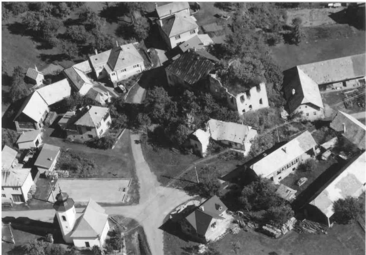
Obr. 1. Letecký pohľad na areál gotického objektu v Dúbravici s bývalými hospodárskymi budovami a Kostolom sv. Žofie. Foto: V. Hanuliak (september 2003)

V obci Dúbravica (okres Banská Bystrica) sa nachádza pomerne málo známy neskorogotický objekt hrádka. Cieľom príspevku je poukázať na neznáme historické doklady o jeho minulosti, ktoré by mohli poslúžiť pri jeho ďalšom skúmaní a taktiež upozorniť na jeho dnešný neradostný stav.